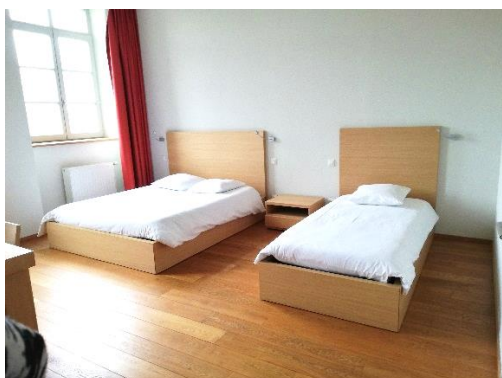
Chambre n° 5