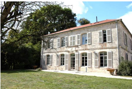
Entrée et terrasse du gîte